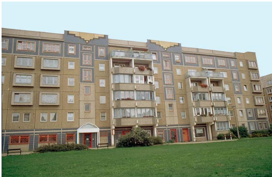
4. kép. A homlokzat átalakítása színezéssel és plasztikával, az architektonikus elemek kiemelésével Neugestaltung von Fassaden durch Farben, Plastiken und Betönung der architektonischen Elemente