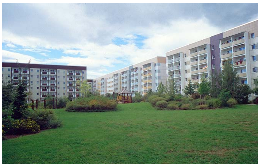
5. kép. Felújított panelépületek zöldterületi rehabilitációval, Lipcse-Grünau városrészről. (A képek a szerző felvételei)

Sanierte Panelgebäuden mit neugestaltetem Grün, eigene Aufnahmen des Autors aus Leipzig-Grünau.