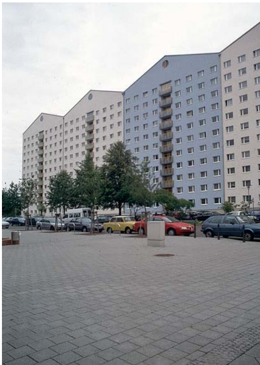
2. kép. Tetőtér-beépítés magastető kialakításával