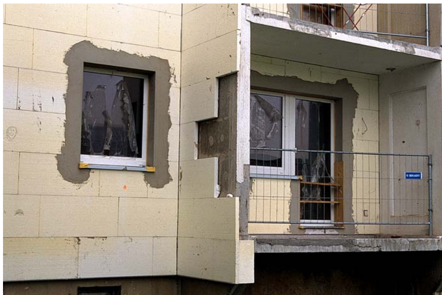
1. kép. Panelépületek külső hőszigetelése és a nyílászárók cseréje

Hazánkban az 1960-as, 70-es és 80-as években kiépült paneles lakótelepek többségében a távhőellátás vált az uralkodó fűtési és melegvíz-ellátási alaptípusá, az iparosított építésmóddal készült panellakásokban a több évtizedes fejlődés alatt azonban többféle távfűtési rendszer került kiépítésre. Az első időszakban kétsőves fűtési rendszerek épültek, amelyek szabályozhatóságuk révén mindenképpen előnyösebbek