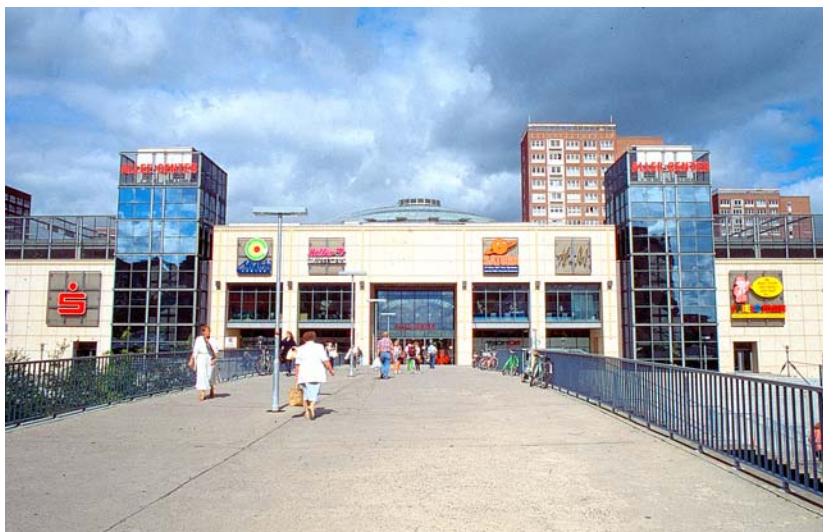
3. kép. Modern városközpont szolgáltató és kiskereskedelmi centrummal

Modernes Stadtzentrum mit Dienstleistungen und Kleinhandel